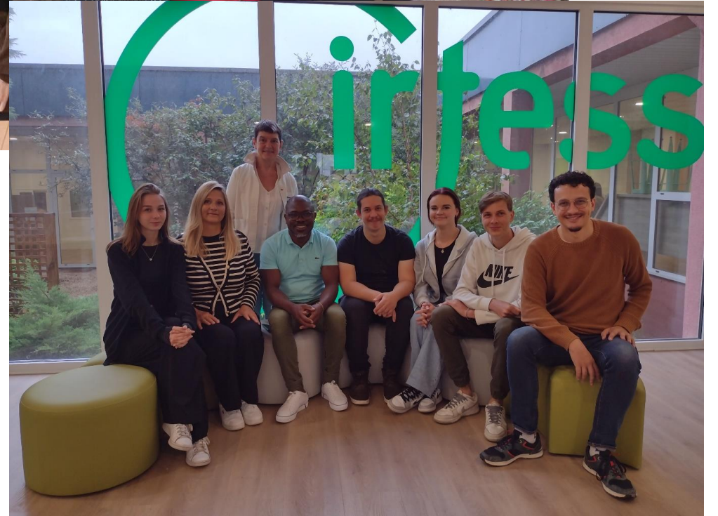
Technicien en intervention sociale et familiale IRTESS