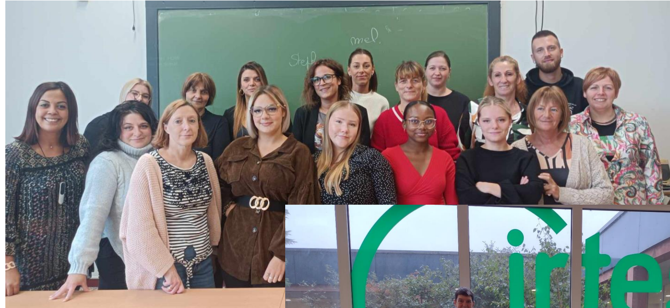
Aide à domicile - EAFC